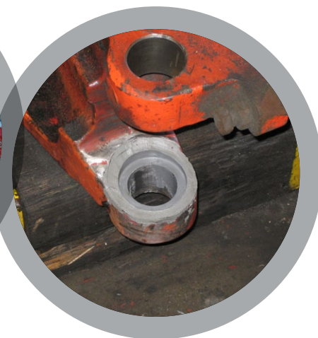
Повторная посадка подшипников