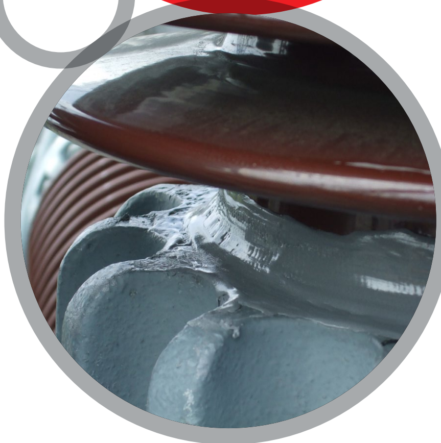
Герметизация соединения изолятора

За более детальной информацией обратитесь к местному представителю Belzona: