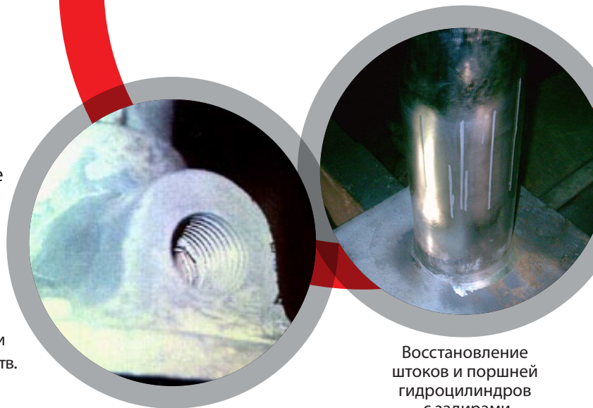
Формовка сорванной резьбы